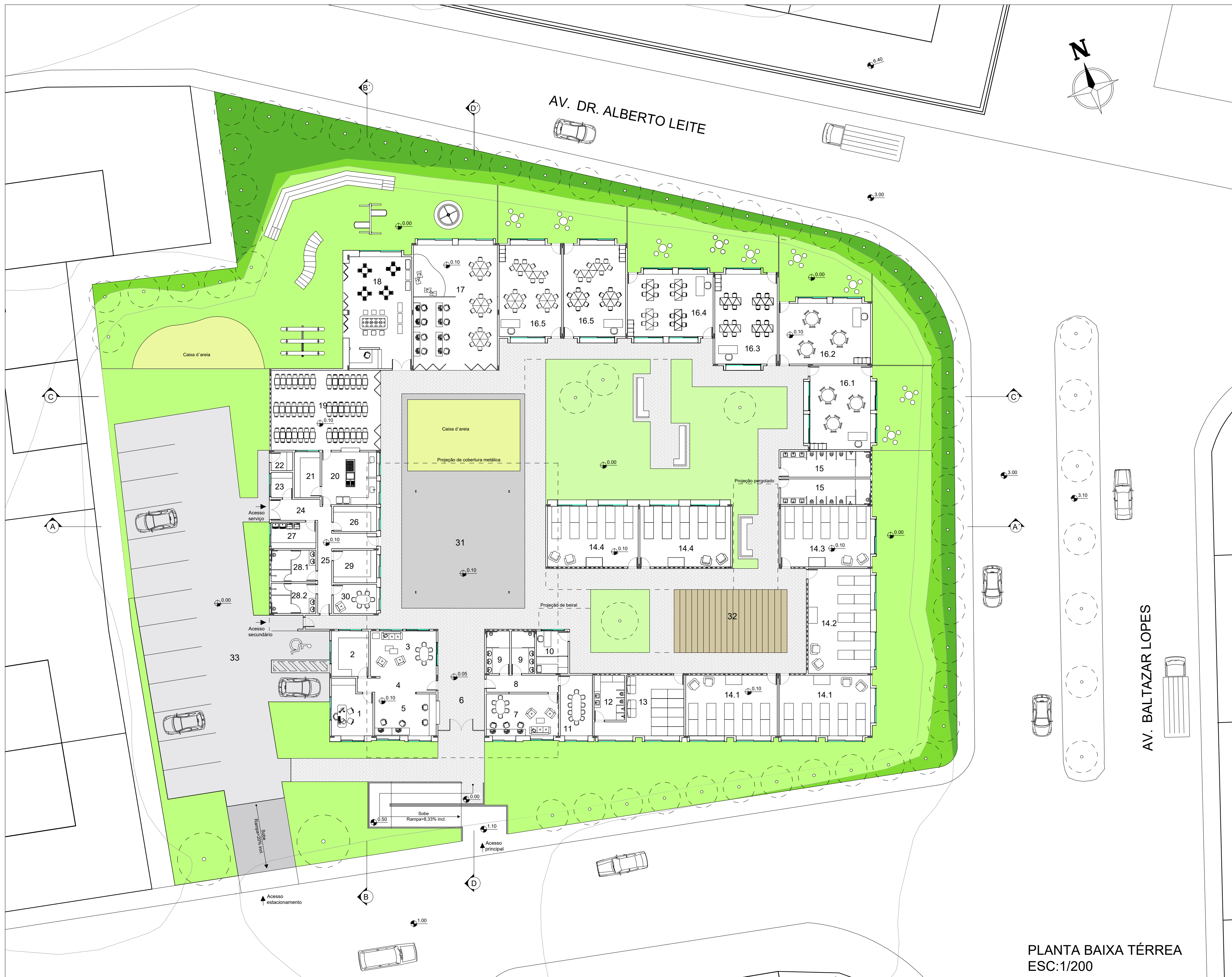
PLANTA BAIXA TÉRREA ESC:1/200